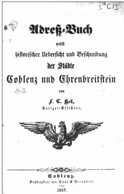
Titelblatt des Koblenzer Adressbuches aus dem Jahr 1857

Ware oder Dienstleistung miteinander Kontakt aufnehmen konnten.