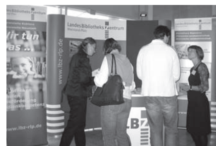
Das LBZ beim 11. Forum Medienkompetenz in Koblenz.